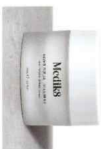
NIGHT RITUAL VITAMIN A™ Αντιγηραντική Κρέμα Ρετινόλης

Όλες οι κρέμες και οι οροί μας με Βιταμίνη Α έχουν σχεδιαστεί με προηγμένα συστήματα τεχνολογίας Χρονικής Ανελευθέρωσης. Αυτό εξασφαλίζει ότι η Βιταμίνη Α παρέχεται σε μικρές δόσεις καθόλη τη διάρκεια της νύχτας χωρίς να κατακλύζει το δέρμα.