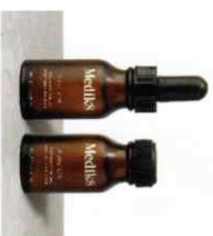
PURE C15™ Ορός Βιταμίνης C με Ασκορβικό Οξύ