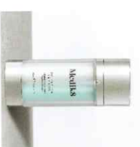
COPPER PCA PEPTIDES™ Ορός με Ορυκτά Αντιοξειδωτικά Πεπτιδία