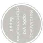
CLARITY PEPTIDES™ Με πεπτιδία και Νισαϊνομίλη 10%