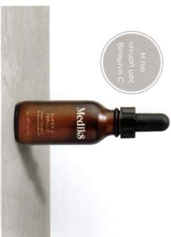
SUPER C FERULIC™ Δραστικός Ορός Φαινευσίμότητας με Βιταμίνη C