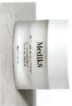
DAILY RADIANCE VITAMIN C™ 2 σε 1 Ευωδιακή C-Tetra Κρέμα με SPF30