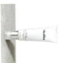
CALMWISE™ COLOUR CORRECT Ενυδατική κρέμα Εξουδετέρωσης Ερυθρότητας

Στη Medik8 έχουμε ένα μεγάλο εύρος από ενυδατικές που καλύπτουν όλες τις ανάγκες του δέρματος σας.