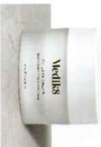
C-TETRA® CREAM Κρέμα Λάμψης Αντιδερμικής Μορφής Βιταμίνης C