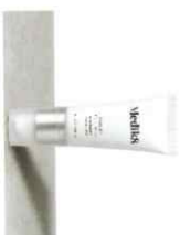
EYELIFT PEPTIDES™ Αντιγηραντικό Τζελ Σύσφιξης