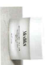
ADVANCED NIGHT RESTORE™ Αναζωογονητική Κρέμα Νυκτός με Πολυκεραμίδια