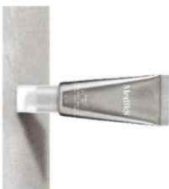
CRYSTAL RETINAL Σταθερός Ορός Νύχτας με Ρετιναλδεΰδη Διαθέσιμος σε 1/3/6/10/20*

*Η Crystal Retinal 20 είναι διαθέσιμη μόνο για κληνικές μετά από ιατρική συνταγή.