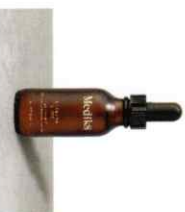
C-TETRA® LUXE Ενισχυμένος Ορός Λάμψης Αντιδερμικής Μορφής Βιταμίνης C