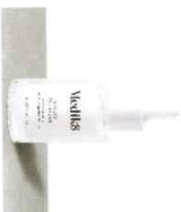
LIQUID PEPTIDES™ Ορός με Σιληλάκο Πολυπεπτιδίων 30%

Η Medik8 έχει ένα μεγάλο εύρος από συνδυασμούς με πρωτοπορικά πεπτιδία τα οποία στοχεύουν σε κάθε πιθανό πρόβλημα του δέρματος.