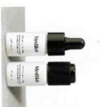
OXY-R PEPTIDES™ Υψηλής Ισχύος Ορός με Λευκαντικό Πεπτιδίο Οξυρεσβεραδώνης