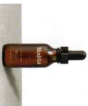
C-TETRA® Ορός Λάμψης Αντιδερμικής Μορφής Βιταμίνης C

Η Ισχυρή αυτή Βιταμίνη καταναλώνει τις ελεύθερες ρίζες, απορρέοντας τη δημιουργία λεπτών γραμμών, πυτίδων, ηλικιών κηλίδων, κηλίδας και του ανομοιομορφου τόνου του δέρματος. Αλλά η δράση της δε σταματά εκεί, η Βιταμίνη C έχει οπικά αποτελέσματα στον όγκο και τη σφαιρικότητα της επιδερμίδας, βελτιώνοντας παρόμοια τον συνολικό τόνο του δέρματος κι ενισχύοντας τη φαινευσίμότητά του.