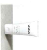
ULTIMATE RECOVERY™ Κρέμα Ανοκατάστασης και Κλειδώματος της Υγρασίας του Δέρματος