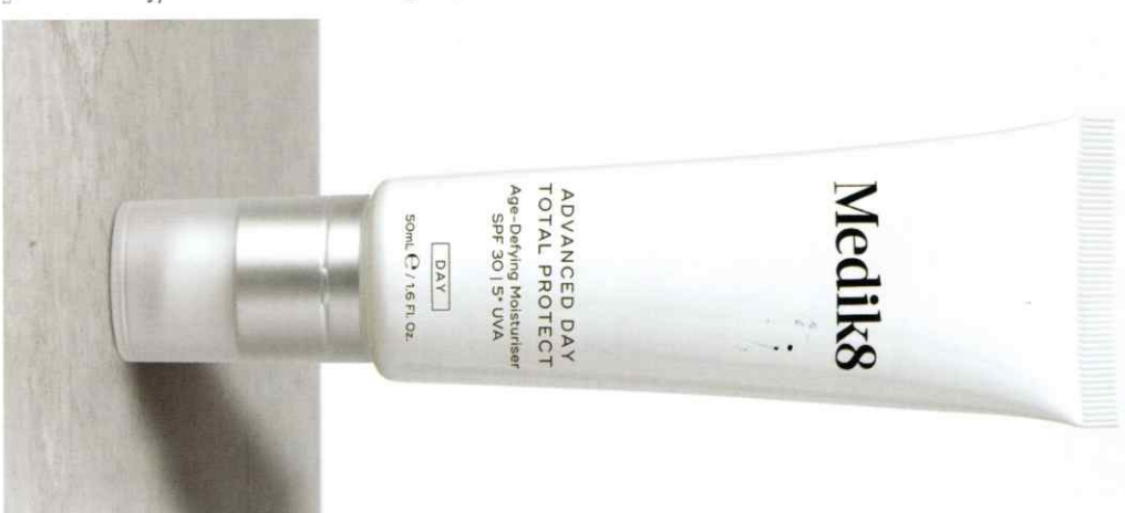
ADVANCED DAY TOTAL PROTECT™ Αντιηλιακή Ευωδιακή με SPF 30 | 5* UVA