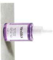
BAKUCHIOL PEPTIDES™ Ενυδακτικός Ορός Πετινάλης Εμποτισμένος με Πεπτιδία