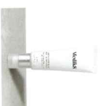
ADVANCED DAY TOTAL PROTECT™ Ενυδατική με SPF 30 | 5+ UVA