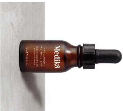
INTELLIGENT RETINOL Υπερπροφθορούμενος Ορός Βιταμίνης Α Διαθέσιμος σε 3TR/6TR/10TR