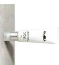
ADVANCED DAY ULTIMATE PROTECT™ Αντιηλιακή Ευωδιακή με Φωτολάνθον SPF 50+ | PA++++ Κυκλοφορία 2021