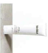
PHYSICAL SUNSCREEN™ Αντιηλιακό Ευεχές Φόρεμα με Προστασία από τη Περίβλαστητική Πύληση, SPF50 και Ανθεκτικό στο Νερό (80 λεπτά) To Physical Sunscreen είναι μόνο δημοσίευση για πληροφορίες & ιστορούμενα