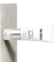
ADVANCED DAY EYE PROTECT™ Αντιηλιακή Κρέμα Ματιών με SPF 30 | 5* UVA

Ελαφριά και απόλυτα διαφανή, δεν ήταν ποτέ πιο εύκολη η εύρεση της τέλειας προστασίας από τον ήλιο.